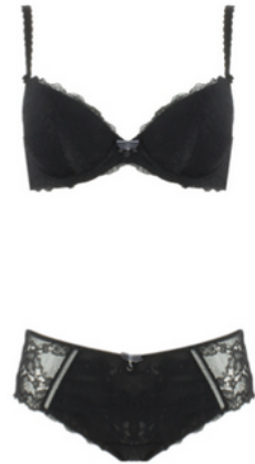
© Charlott' Attitude Eclipse Push up 49€ Shorty 29€