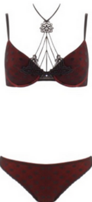
© Charlott' Extrême String 49€ SG 84€