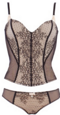
© Charlott' La belle étoile Bustier 119€ -slip 45€