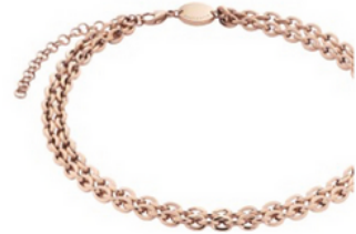
© Energetix Collier double chaîne or rose 89 €