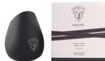
© Soft Paris Bougie de massage 28 €

Pour ma part, j'ai fait ma petite sélection de produits sexy chez Charlott' et Soft Paris avec des parures glamour et des jouets coquins pour une folle soirée !