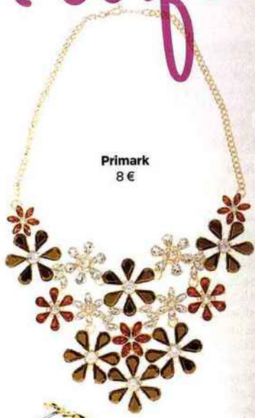
Primark 8 €