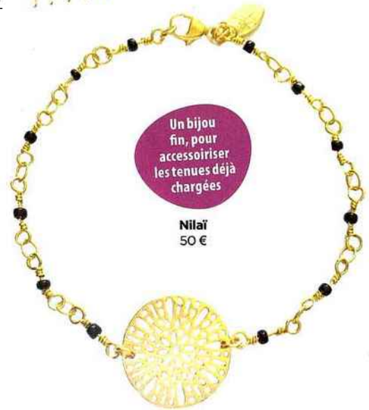
Un bijou fin, pour accessoriser les tenues déjà chargées