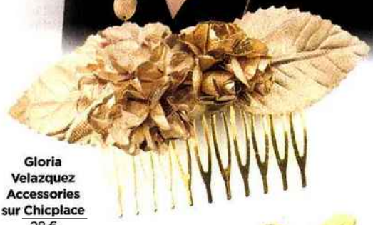
Gloria Velazquez Accessories sur Chicplace 28 €