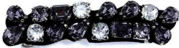
Faites scintiller vos cheveux! Biguine 12 €