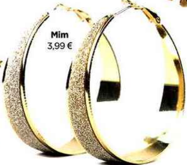
Mim 3,99 €