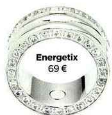
Energetix 69 €