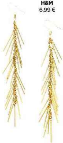
H&M 6,99 €

Noa-Kis Pendentifs : 29 € Collier ras du cou doré ou argenté : 39 € Sautoir doré ou argenté : 69 €