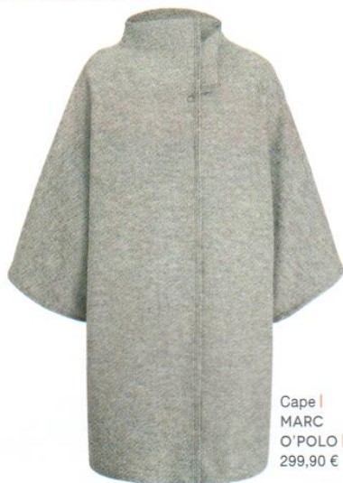
Cape | MARC O'POLO | 299,90 €