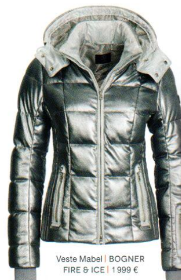
Veste Mabel | BOGNER FIRE & ICE | 1999 €