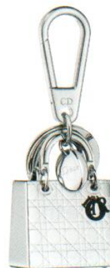
Porte-clés Lady Dior en métal et émail noir | DIOR | 330 €