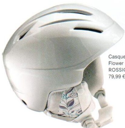
Casque Flower Grey | ROSSIGNOL | 79,99 €

Michel Onfray, Haute École, Brève histoire du cheval philosophique, relié sous jaquette, 192 pages | ÉDITIONS FLAMMARION | 30 €