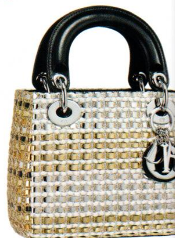
Mini-sac Lady Dior en tweed métallique tressé or et argent | DIOR | 2800 €