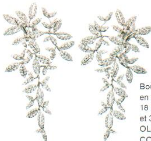
Boucles d'oreilles en or blanc 18 carats et 360 diamants | OLE LYNGGAARD COPENHAGEN | 27850 €