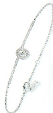
Bracelet Amazone | MESSIKA | 2140 €