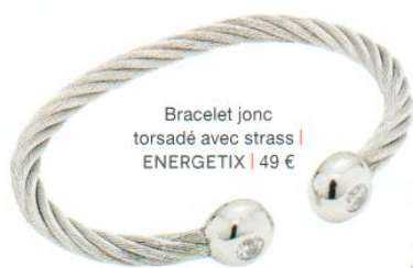
Bracelet jonc torsadé avec strass | ENERGETIX | 49 €