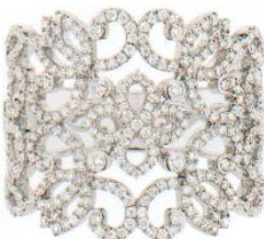
Bague Éden carrée | MESSIKA | 4370 €