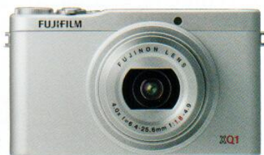
XQ1 ultra compact | FUJIFILM | 399 €