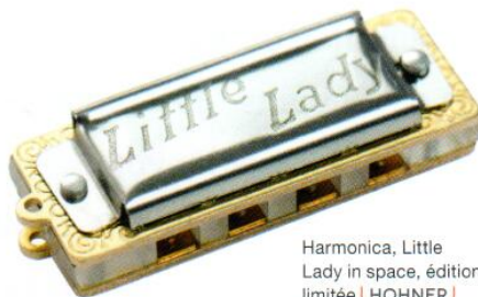
Harmonica, Little Lady in space, édition limitée | HOHNER | 14,90 €