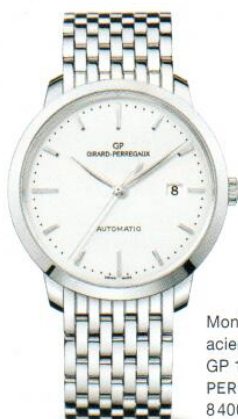
Montre mécanique acier à remontage, GP 1966 | GIRARD PERREGAUX | 8400 €