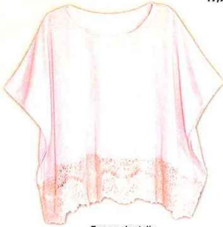
Top en dentelle H&M = 12,99 €