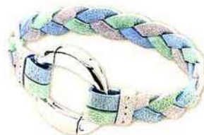
Bracelet tressé ENERGETIX = 74 €