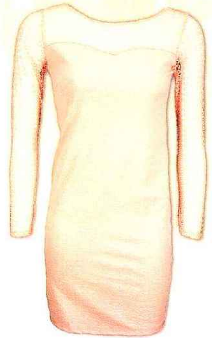
Robe manches en dentelle STAND-PRIVE.COM 19 €