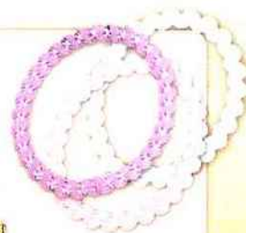
Bracelets Wire POLYVORE 5 €