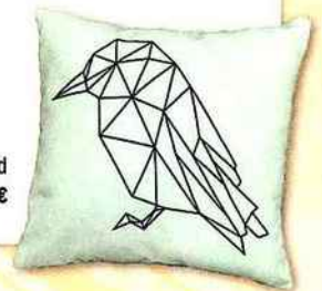
Coussin édition Bird ATYLIA = 27 €