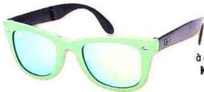
Lunettes de soleil Wayfarer RAY-BAN = 177,99 €