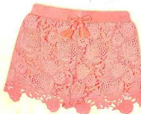
Short en crochet PRIMARK 7 €