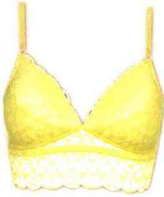
Bustier en dentelle PRIMARK 4 €