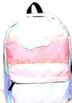
Sac à dos Ombre Stripe VANS 49,29 €