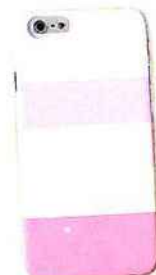
Coque en silicone MYPHONECASE.ORG 30 €