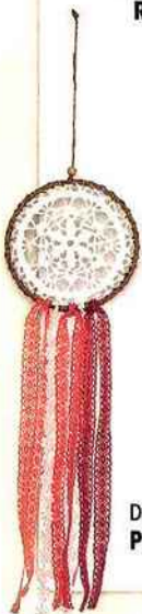
Dreamcatcher PRIMARK = 2,50 €