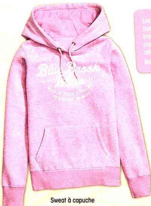
Sweat à capuche H&M = 24,99 €

Les Suede sont certainement les plus renommées de toutes les baskets de la marque Puma. Première chaussures de l'histoire du breakdance, ce classique de design est toujours culte et en pleine forme. Cette version féminine déborde de confort et affiche fièrement ses racines et son style urbains. Baskets Suede Classic = PUMA = 75 €