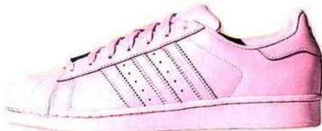
Baskets Superstar Originals ADIDAS 80 €